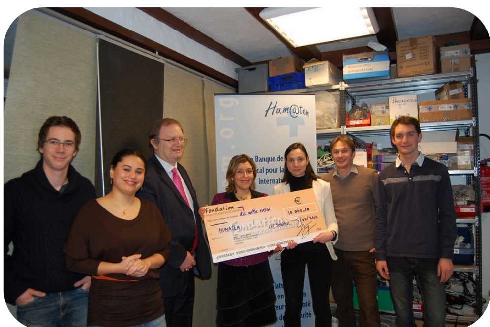
Soutien financier de la Fondation Peugeot en 2012, pour l'achat d'un véhicule utilitaire neuf