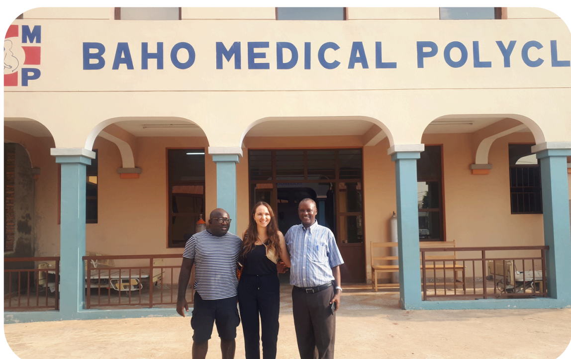
Hôpital BAHO, bénéficiaire de la banque de dons

- 150 prestations techniques et logistiques réalisées