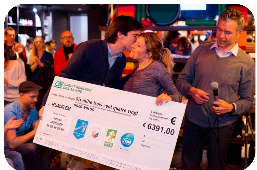
Soutien financier du Rotary Club Chamonix-Mont-Blanc Megève et de l'Hôtel Heliopic en 2017